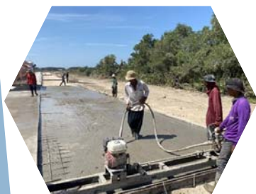
งานเทคอนกรีต ถนน คสล.