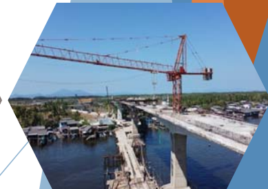
งานเทคอนกรีต Balance

“คุณภาพเป็นหนึ่ง คำนึงความปลอดภัย ใส่ใจจราจร เอื้ออาทรประชาชน”