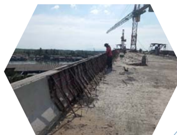
งานติดตั้ง Barrier