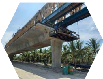
งานติดตั้งอัดแรงตามยาว Box Segment ช่วง P16-P17