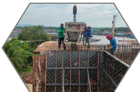
งานเทคอนกรีตผนัง P8