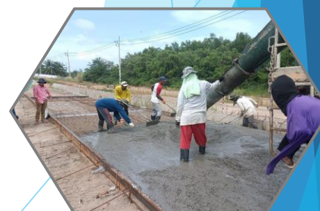
เทคอนกรีตงานถนน

“คุณภาพเป็นหนึ่งใน คำนึงความปลอดภัย ใส่ใจจราจร เอื้ออาทรประชาชน”