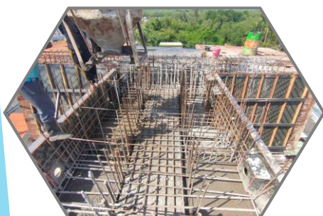
งานเทคอนกรีตหัวเสา P8