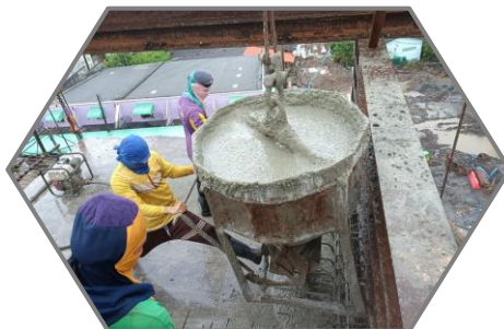
งานเทคอนกรีตพื้นล่างและผนัง Balance P9 Type C-C