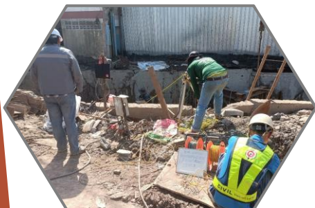
ทดสอบเสาเข็มเจาะ โดยวิธี Seismic, Sonic logging. P8/6,P8/7,P8/8