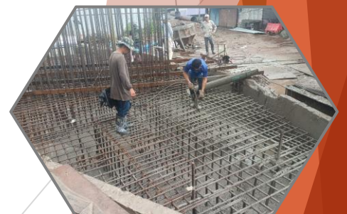
งานเทคอนกรีตฐานราก P8

“คุณภาพเป็นหนึ่งใน คำนึงความปลอดภัย ใส่ใจจราจร เอื้ออาทรประชาชน”