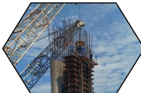
เทคอนกรีตโครงสร้างเสาตอม่อ P9 ต้นที่ 2