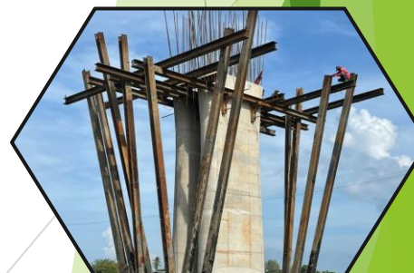
ติดตั้งนั่งร้านรับ Pier P9

“คุณภาพเป็นหนึ่ง คำนึงความปลอดภัย ใส่ใจจราจร เอื้ออาทรประชาชน”