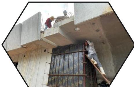
เทคอนกรีตกำแพง P1