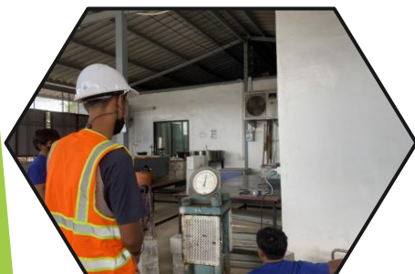
งานทดสอบคุณสมบัติ ก้อนคอนกรีต