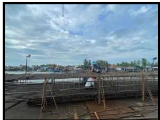
ภาพแสดงงานผูกเหล็กเสาดอม่อ P๑