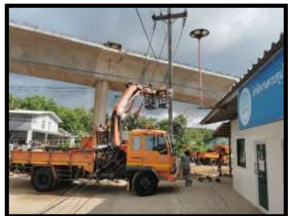
ภาพแสดงงานรื้อย้ายสายไฟฟ้าบริเวณโครงการ โดยเจ้าของหน่วยงาน