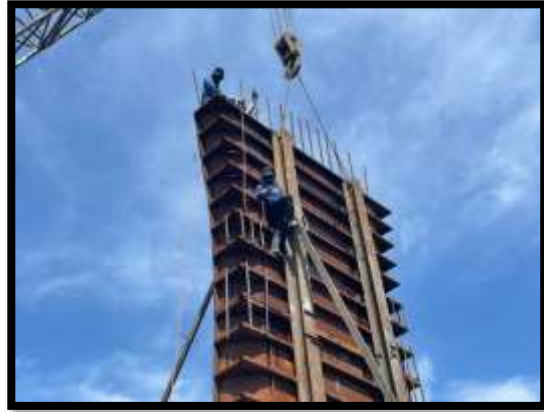
ภาพแสดงงานติดตั้งแบบโครงสร้างเสาตอม่อ P๙ ต้นที่ ๑