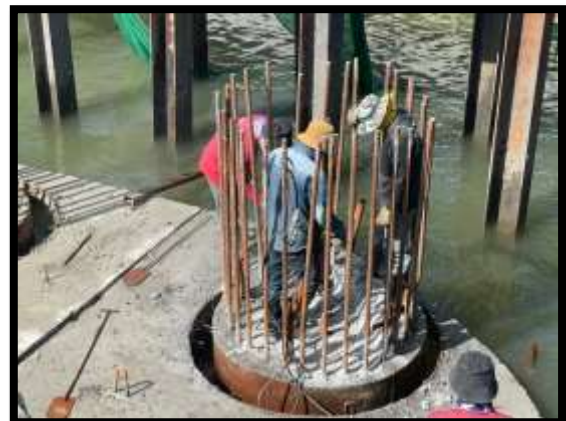
ภาพแสดงงานตัด ตกแต่ง งานเสาเข็มเจาะ P๔