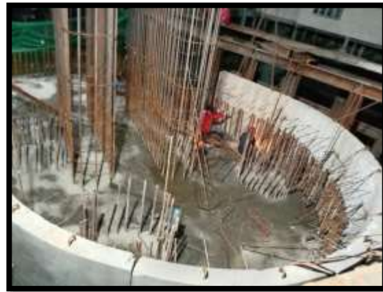
ภาพแสดงงานติดตั้ง Precast Skirt P๑