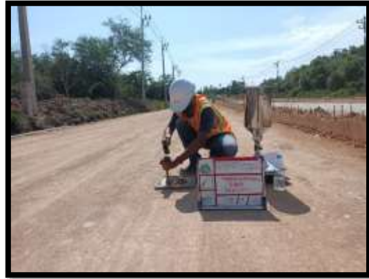
ภาพแสดงงานทดสอบความหนาแน่นชั้นรองพื้นทาง งานถนน Sta.๐+๕๕๐ ถึง Sta.๐+๗๐๐ LT