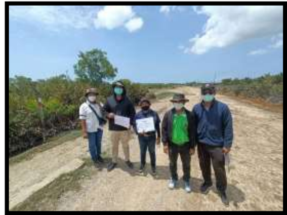
ภาพแสดงงานลงพื้นที่ตรวจสอบแนวเขตที่ดินร่วมกับกรรมการจัดซื้อที่ดิน