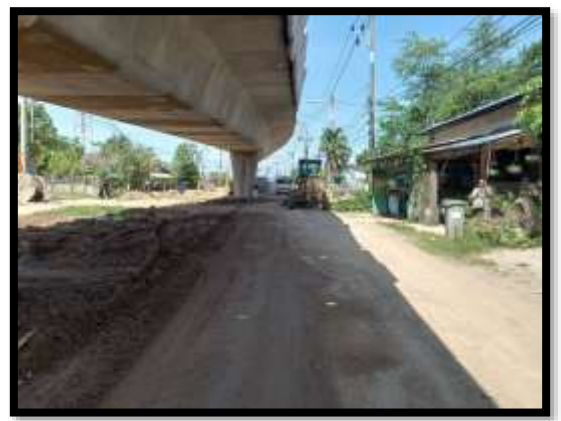
ภาพแสดงงานปรับเกลี่ยและบดอัดชั้นรองพื้นทาง (หนา ๐.๒๐ ม.) งานถนน Sta.๐+๕๐๐ ถึง Sta.๐+๗๐๐ RT