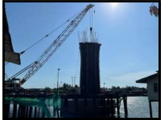
ภาพแสดงงานติดตั้งแบบโครงสร้างเสาตอม่อ P๙ ต้นที่ ๒