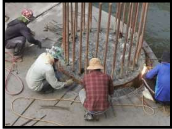
ภาพแสดงงานติดตั้งตะแกรงรอบเสาเข็ม งานเสาเข็มเจาะ P๙