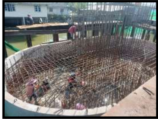
ภาพแสดงงานผูกเหล็กฐานราก P๔