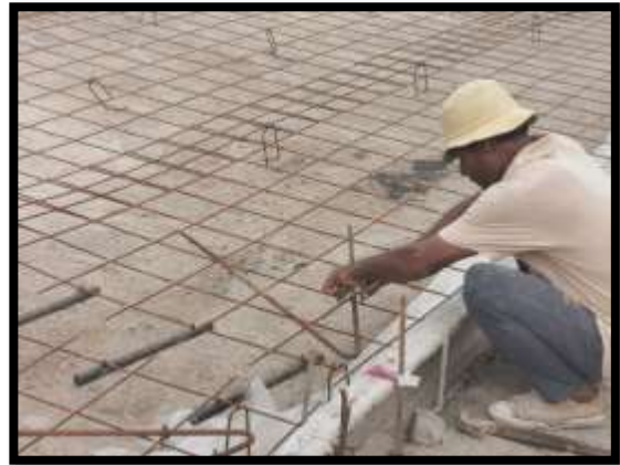
ภาพแสดงงานติดตั้งเหล็ก Wire Mesh งานถนน Sta.๐+๔๗๐ ถึง Sta.๐+๕๐๐ LT (ส่วนขยาย จาก CL)