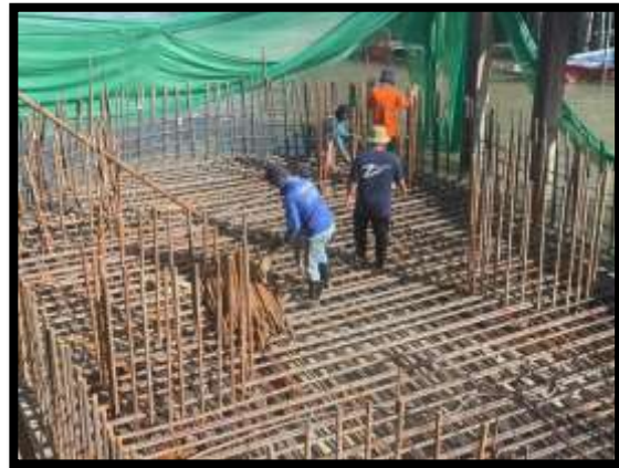
ภาพแสดงงานผูกเหล็กฐานราก งานเสาเข็มเจาะ P๙