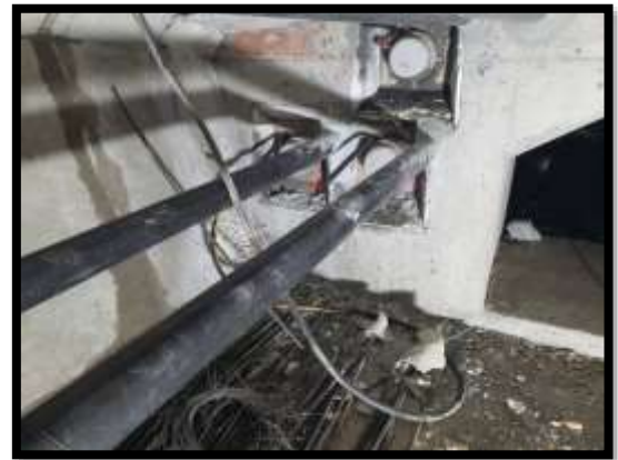
ภาพแสดงงานอัดฉีดปูน Grout ภายในท่อลวดอัดแรง ช่วง P๔ ถึง P๗