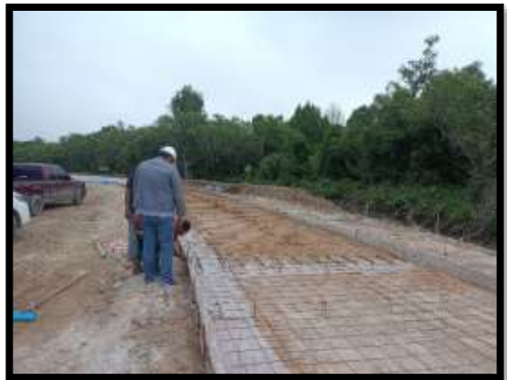
ภาพแสดงงานติดตั้งเหล็ก Wire Mesh งานถนน Sta.๐+๔๗๐ ถึง Sta.๐+๕๐๐ LT (ส่วนขยาย ไหล่ทาง)