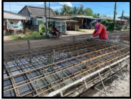
ภาพแสดงงานผูกเหล็ก Precast Skirt P๑๐