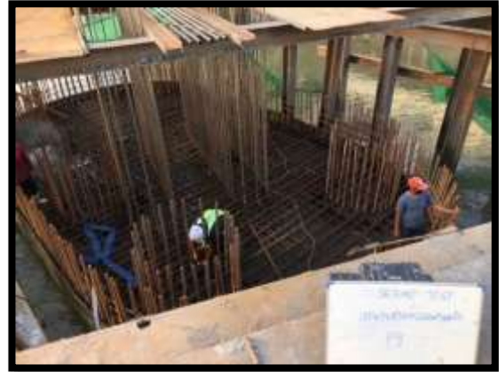
ภาพแสดงงานทดสอบ Seismic งานเสาเข็มเจาะ P๘ และ P๙