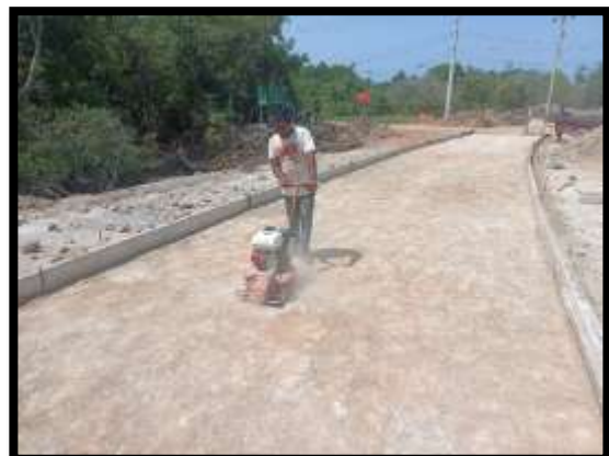
ภาพแสดงงานเข้าแบบและบดอัดชั้นทรายหยาบ งานถนน Sta.๐+๔๗๐ ถึง Sta.๐+๕๐๐ LT (ส่วนขยาย ไหล่ทาง)