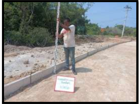
ภาพแสดงงานตรวจสอบระดับชั้นทรายหยาบและระดับแบบข้าง งานถนน Sta.๐+๔๗๐ ถึง Sta.๐+๕๐๐ LT (ส่วนขยาย ไหล่ทาง)