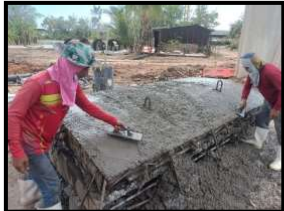
ภาพแสดงงานเทคอนกรีต Precast Skirt P๑๐