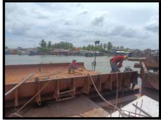
ภาพแสดงงานเตรียมแบบเสาดอม่อ P๑