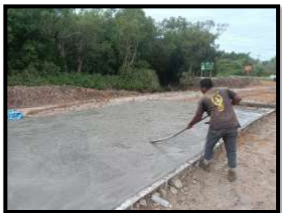
ภาพแสดงงานเทคอนกรีต งานถนน Sta.๐+๔๗๐ ถึง Sta.๐+๕๐๐ LT (ส่วนขยาย ไหล่ทาง)