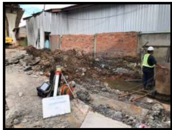
ภาพแสดงงานทดสอบ Sonic Logging งานเสาเข็มเจาะ P๘ และ P๙