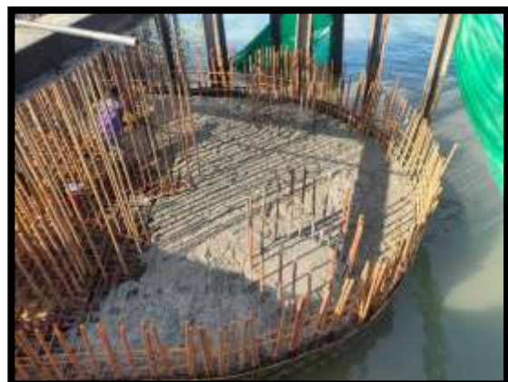
ภาพแสดงงานเทคอนกรีตฐานราก งานเสาเข็มเจาะ P๙