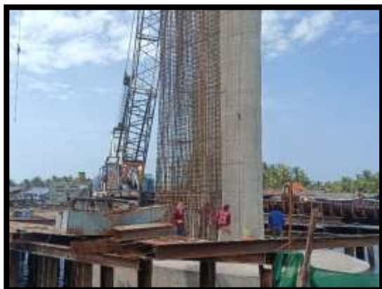
ภาพแสดงงานผูกเหล็กโครงสร้างเสาตอม่อ P๙ ต้นที่ ๒