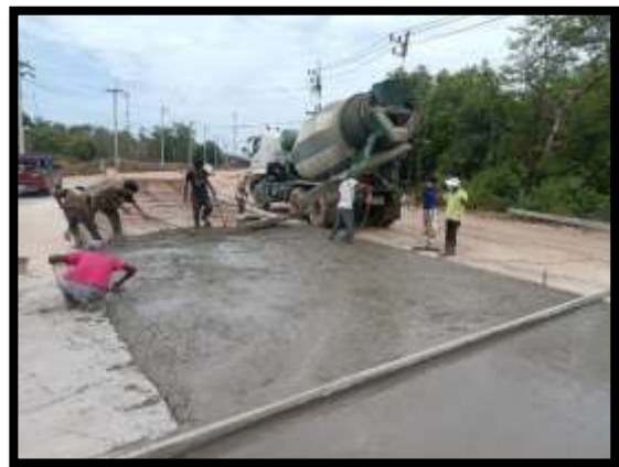
ภาพแสดงงานเทคอนกรีต งานถนน Sta.๐+๔๗๐ ถึง Sta.๐+๕๐๐ LT (ส่วนขยาย จาก CL)