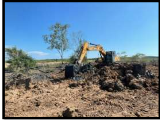
ภาพแสดงงานกรุยทางถางป่า งานถนน Sta.๑+๑๗๕ ถึง Sta.๒+๕๐๐ (ฝั่งเกาะ)