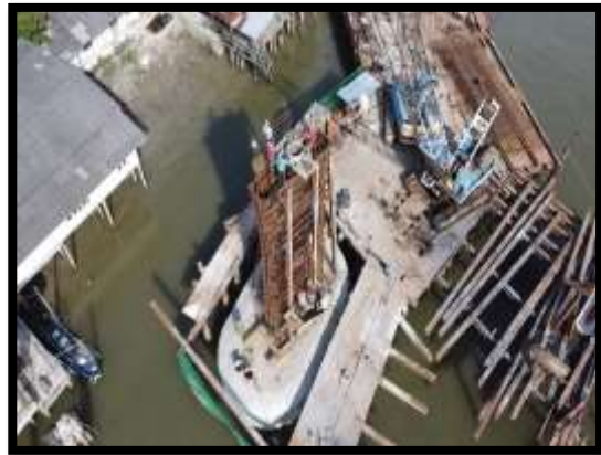
ภาพแสดงงานเทคอนกรีตโครงสร้างเสาตอม่อ P๙ ต้นที่ ๑