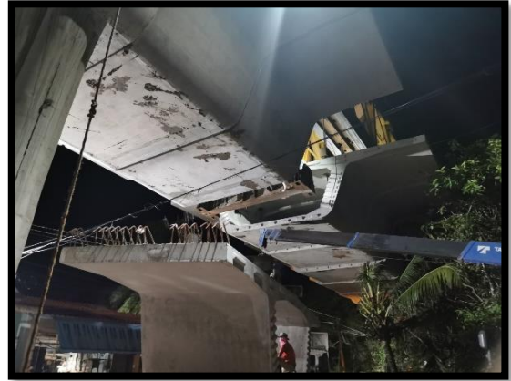
ภาพแสดงงานติดตั้ง Segment ช่วง P๓ ถึง P๔