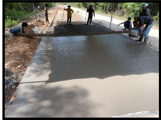
ภาพแสดงงานเทคอนกรีต งานถนน Sta.๐+๐๒๐ ถึง Sta.๐+๑๐๐ LT