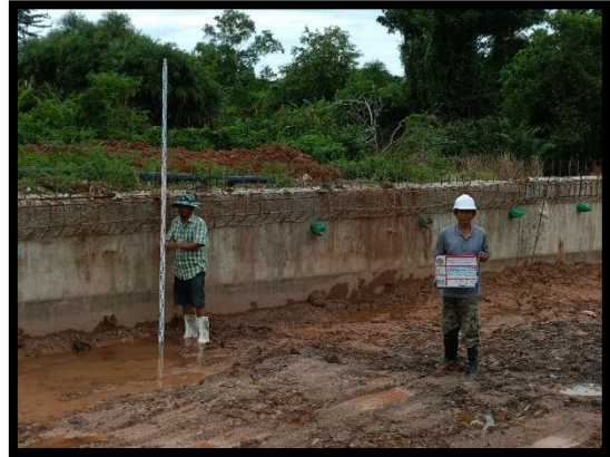
ภาพแสดงงานเก็บ Cross Section ดินเดิม งานกำแพงกันดิน Sta.๐+๕๓๑ ถึง Sta.๐+๖๑๒