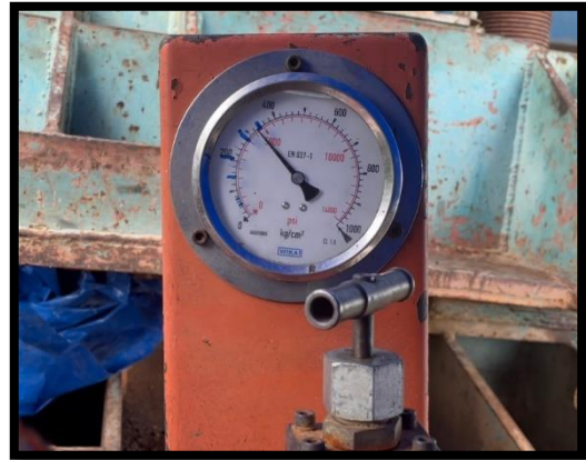
ภาพแสดงงานดัดลวด Segment ๑๐๐ % ตามยาว ช่วง P๒ ถึง P๓