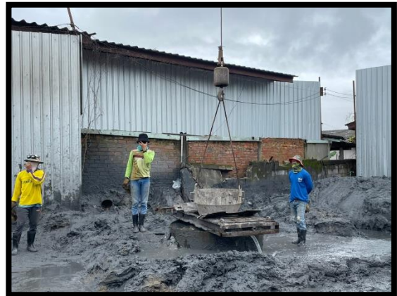
ภาพแสดงงานเทคอนกรีต งานเสาเข็มเจาะ P๘ ต้นที่ ๒