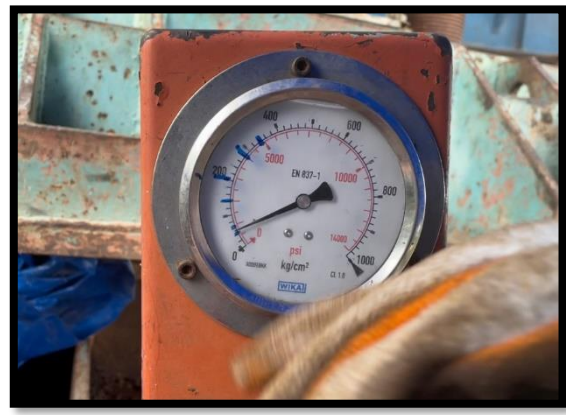
ภาพแสดงงานดึงลวด Segment ๑๕ % ตามยาว ช่วง P๑ ถึง P๒