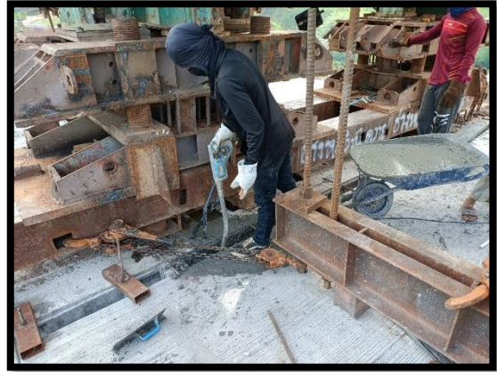
ภาพแสดงงานเทคอนกรีต Wet Joint Segment ช่วง P๒ ถึง P๓