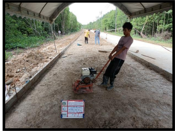
ภาพแสดงงานเข้าแบบข้างและ งานปรับเกลี่ยและบดอัดชั้นทรายหยาบ Sta.๐+๐๒๐ ถึง Sta.๐+๑๐๐ LT