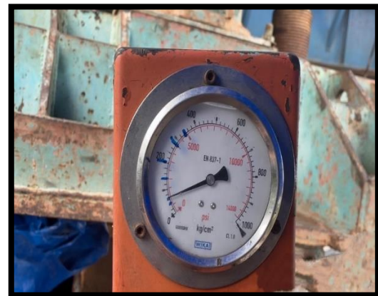
ภาพแสดงงานดึงลวด Segment ๑๕ % ตามยาว ช่วง P๓ ถึง P๔