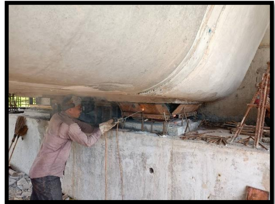
ภาพแสดงงานเข้าแบบ Pot Bearing P๑