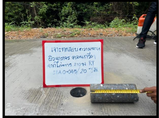
ภาพแสดงงานทดสอบความหนาแน่นคอนกรีต งานถนน Sta.๐+๐๔๕ และ Sta.๐+๒๕๘ RT