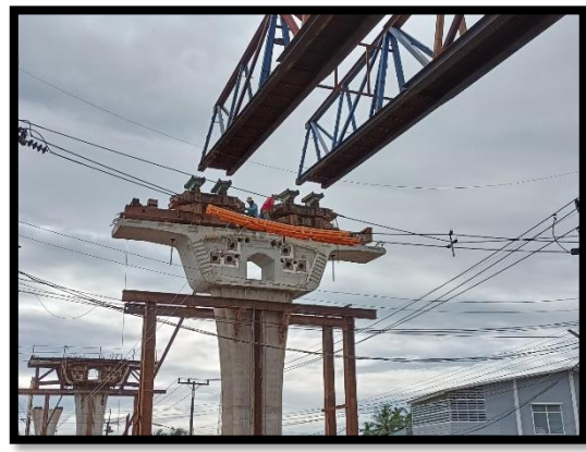
ภาพแสดงงานเคลื่อนย้ายตำแหน่ง Launcher Truss ช่วง P๔ และ P๕