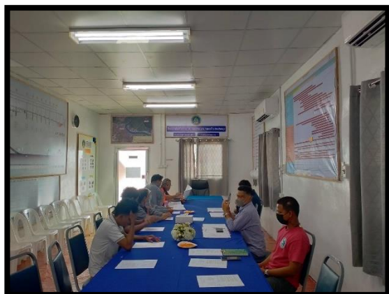
ภาพแสดงการประชุมติดตามความก้าวหน้าของโครงการ