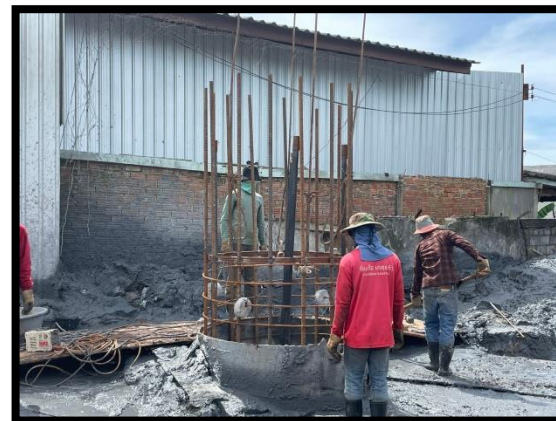
ภาพแสดงงานลงเหล็ก งานเสาเข็มเจาะ P๘ ต้นที่ ๑