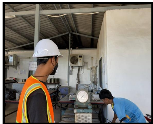
ภาพแสดงการควบคุมคุณภาพของคอนกรีต