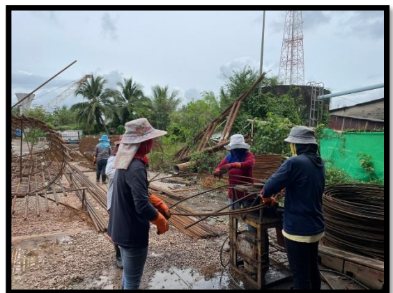
ภาพแสดงงานผูกเหล็ก งานเสาเข็มเจาะ P๘ ต้นที่ ๑