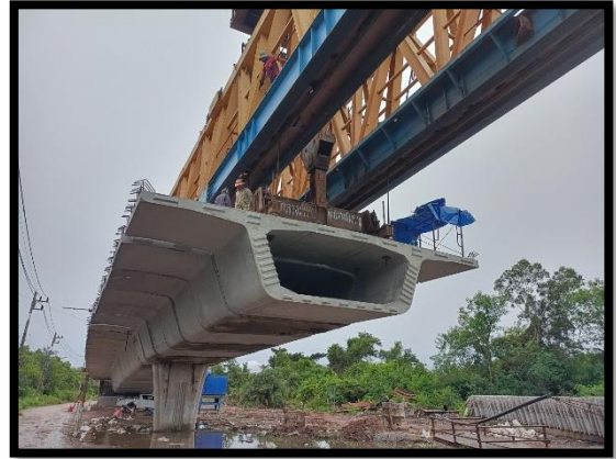
ภาพแสดงงานติดตั้ง Segment ช่วง P๒ ถึง P๓