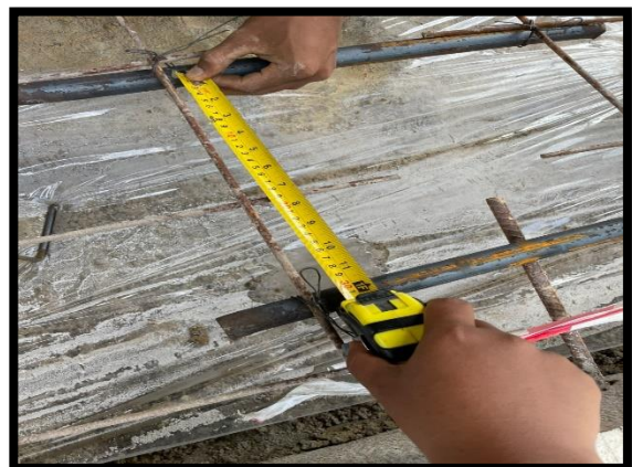
ภาพแสดงงานวางเหล็ก Wire Mesh งานถนน Sta.๐+๐๒๐ ถึง Sta.๐+๑๐๐ LT