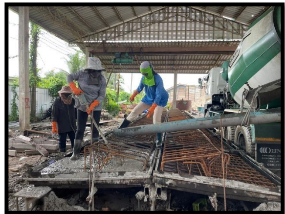
ภาพแสดงงานผูกเหล็ก เข้าแบบ และ เทคอนกรีต Barrier