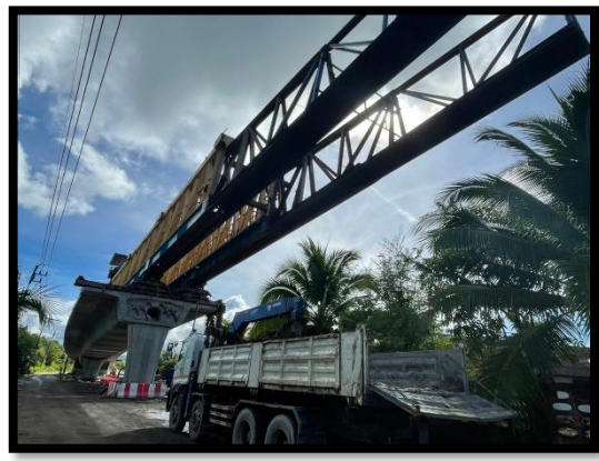
ภาพแสดงงานเคลื่อนย้ายตำแหน่ง Launcher Truss ช่วง P๓ และ P๔