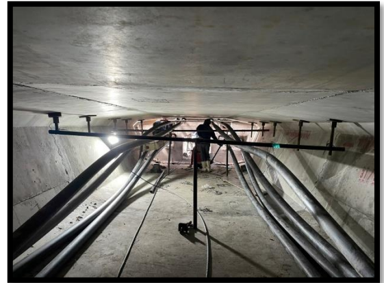
ภาพแสดงงานร้อยลวดอัดแรงใน Segment ช่วง P๓ ถึง P๔