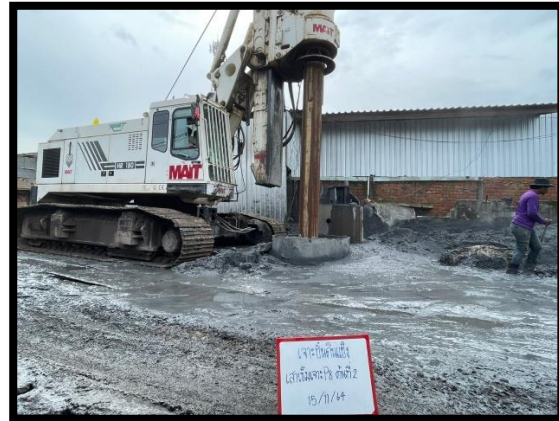
ภาพแสดงงานเจาะชั้นดิน งานเสาเข็มเจาะ P๘ ต้นที่ ๑ และ ต้นที่ ๒