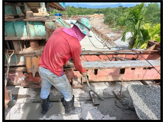
ภาพแสดงงานเทคอนกรีต Wet Joint Segment ช่วง P๓ ถึง P๔