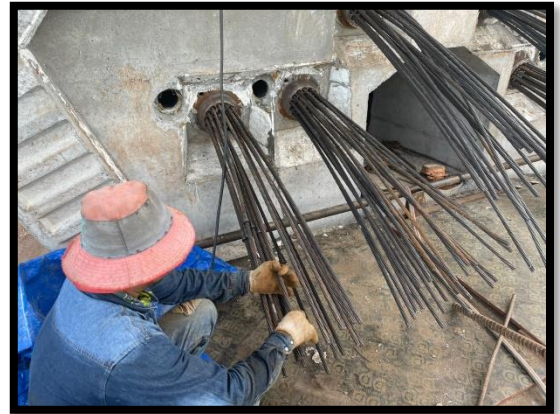
ภาพแสดงงานร้อยลวดอัดแรงใน Segment ช่วง P๒ ถึง P๓