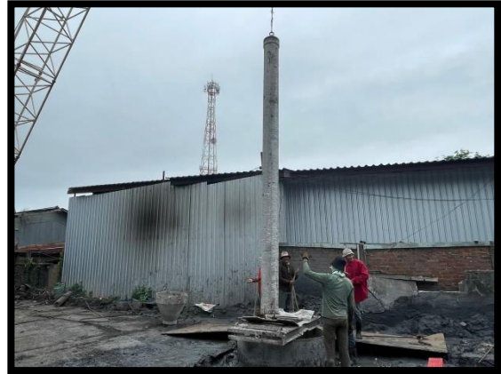
ภาพแสดงงานลง Timmy Pipe งานเสาเข็มเจาะ P๘ ต้นที่ ๒