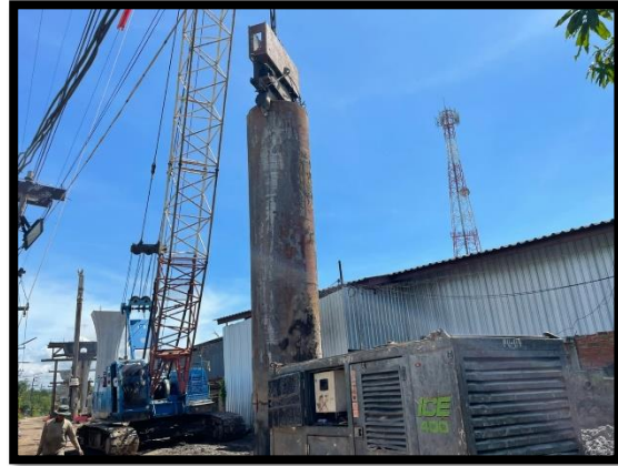
ภาพแสดงงานติดตั้ง Casing งานเสาเข็มเจาะ P๘ ต้นที่ ๑ และ ต้นที่ ๒