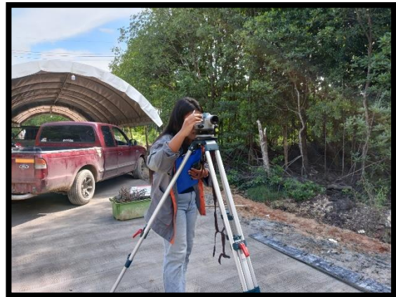
ภาพแสดงงานตรวจสอบระดับหลังแบบ งานถนน Sta.๐+๐๒๐ ถึง Sta.๐+๑๐๐ LT