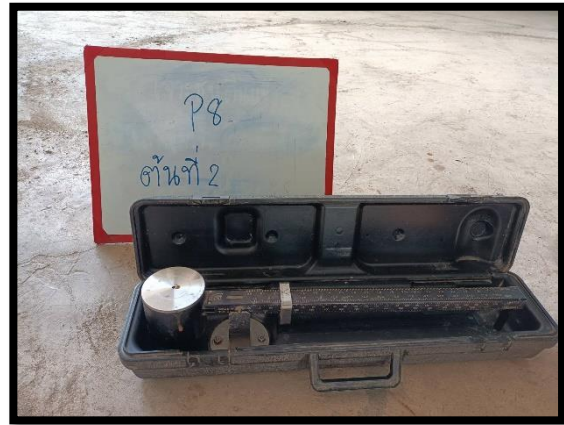
ภาพแสดงการควบคุมคุณภาพสารละลายปูนหลุมเจาะ งานเสาเข็มเจาะ P๘ ต้นที่ ๒