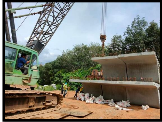
ภาพแสดงงานขนย้าย Segment และปรับพื้นที่เก็บวัสดุแห่งใหม่