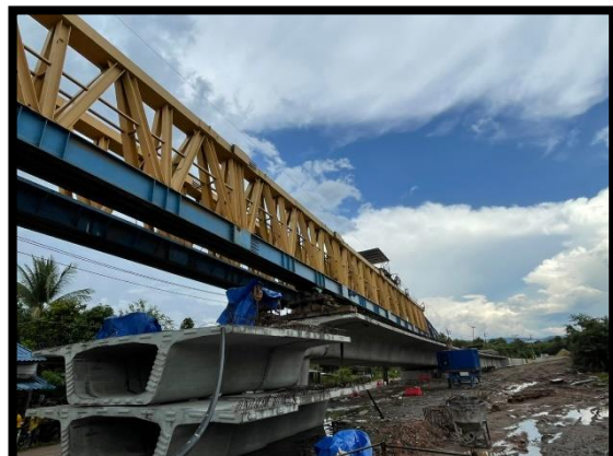
ภาพแสดงงานเคลื่อนย้ายตำแหน่ง Launcher Truss ช่วง P๒ และ P๓