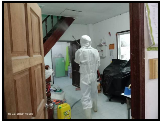
ภาพแสดงการพ่นยาฆ่าเชื้อโควิด ๑๙ ในสถานที่ทำงาน