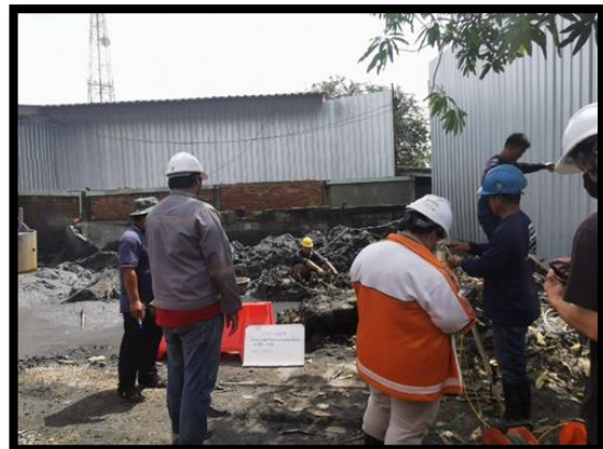
ภาพแสดงการทดสอบ Sonic logging เสาเข็มเจาะ ขนาดเส้นผ่าศูนย์กลาง ๑.๕๐ เมตร P๘