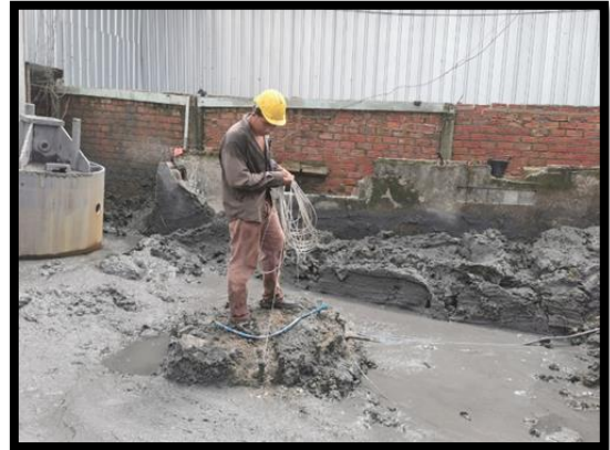
ภาพแสดงการทดสอบ Seismic เสาเข็มเจาะ ขนาดเส้นผ่าศูนย์กลาง ๑.๕๐ เมตร P๘