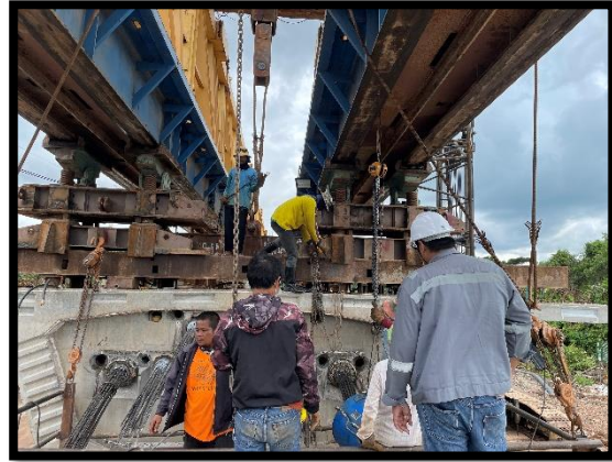
ภาพแสดงงานตรวจสอบการดึงลวดอัดแรง