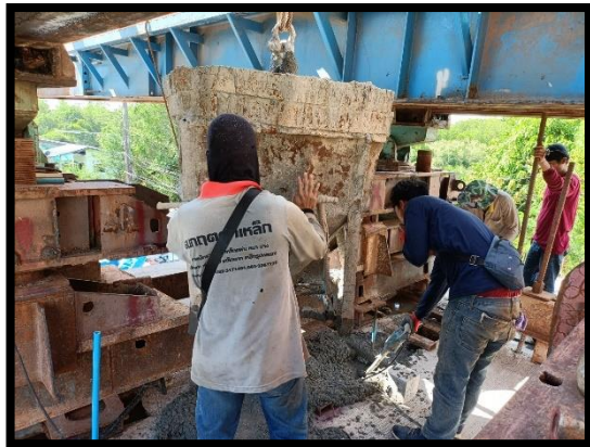
ภาพแสดงงานเทคอนกรีต Wet Joint Segment ช่วง P๑ ถึง P๒