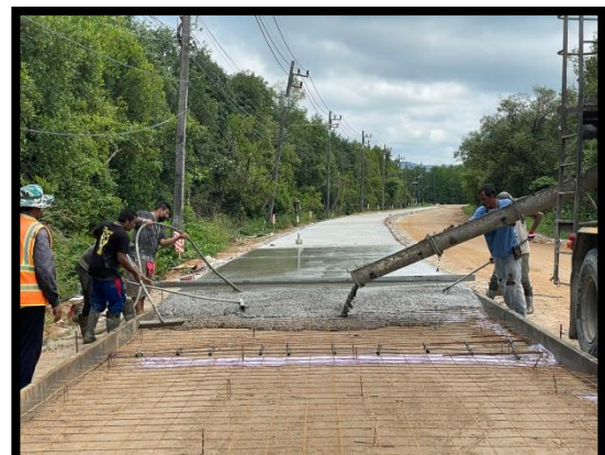
ภาพแสดงงานเทคอนกรีต Sta.๐+๒๘๐ ถึง Sta.๐+๓๑๐ (RT)