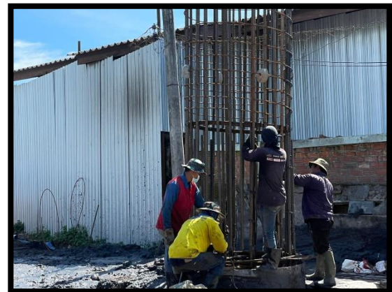
ภาพแสดงงานลงเหล็ก งานเสาเข็มเจาะ P๘ ต้นที่ ๓ และ ต้นที่ ๔