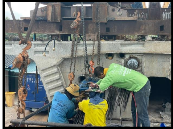
ภาพแสดงงานติดตั้งอัดแรง Segment ๑๕% ตามยาว ช่วง P๑ ถึง P๒