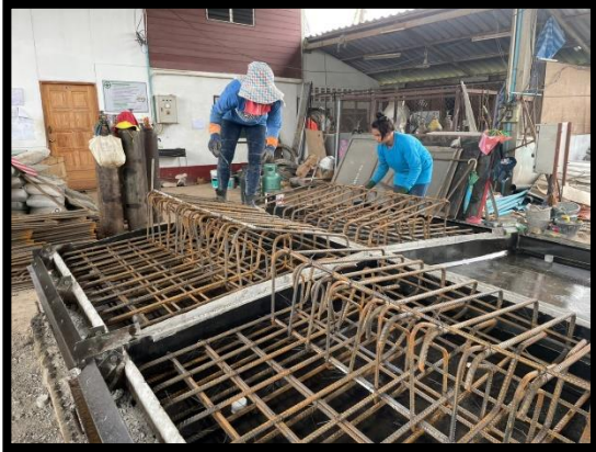
ภาพแสดงงานผูกเหล็ก Barrier