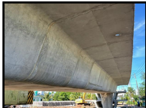
ภาพแสดงงานปรับระดับ Segment ช่วง P๑ และ P๒