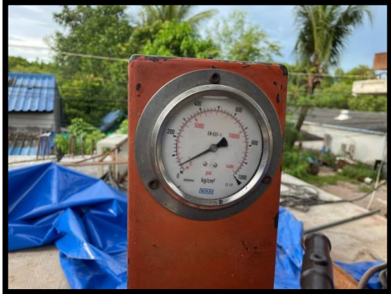
ภาพแสดงงานติดตั้งอัดแรง Segment ๑๕% ตามยาว ช่วง P๑ ถึง P๒