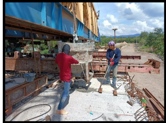
ภาพแสดงงานเทคอนกรีต Wet Joint Segment ช่วง P๑ ถึง P๒