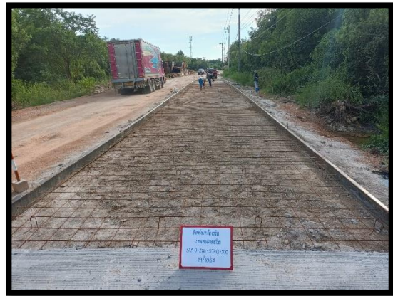
ภาพแสดงงานติดตั้งเหล็กพร้อมเข้าแบบข้าง งานถนน Sta.๐+๒๘๐ ถึง Sta.๐+๓๑๐ (RT)