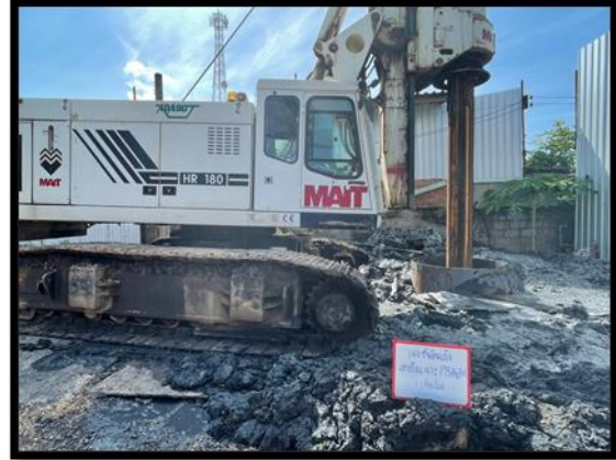
ภาพแสดงงานเจาะชั้นดิน งานเสาเข็มเจาะ P๘ ต้นที่ ๓ และ ต้นที่ ๔