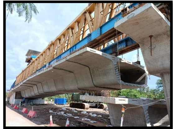
ภาพแสดงงานติดตั้ง Segment ช่วง P๑ และ P๒