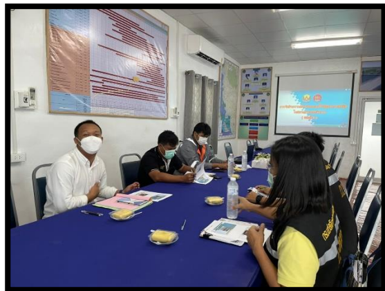
ภาพแสดงการประสานงานกับสวัสดิการคุ้มครองแรงงานจังหวัดสตูล เรื่องโครงการโรงงานสีขาว