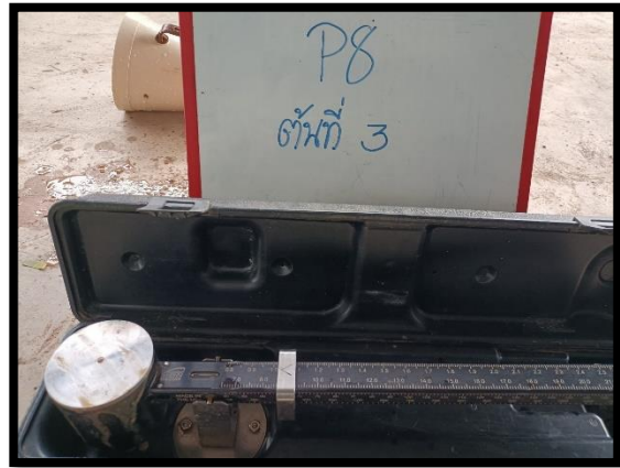
ภาพแสดงการควบคุมคุณภาพสารละลายยุงหลุมเจาะ