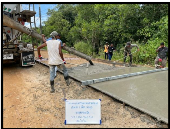
ภาพแสดงงานเทคอนกรีต Sta.๐+๒๘๐ ถึง Sta.๐+๓๑๐ (RT)