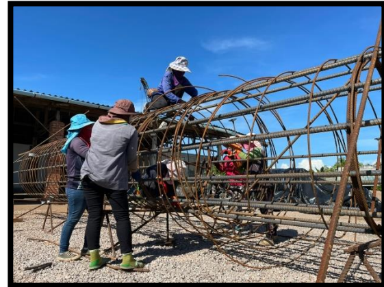
ภาพแสดงงานผูกเหล็กเสาเข็ม งานเสาเข็มเจาะ P๘ ต้นที่ ๓ และ ต้นที่ ๔