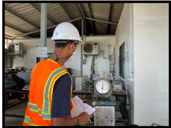
ภาพแสดงการควบคุมคุณภาพคอนกรีต