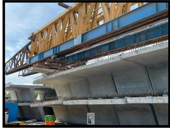
ภาพแสดงงานติดตั้ง Launcher Truss ช่วง P๑ และ P๒