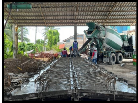
ภาพแสดงงานเทคอนกรีต Barrier