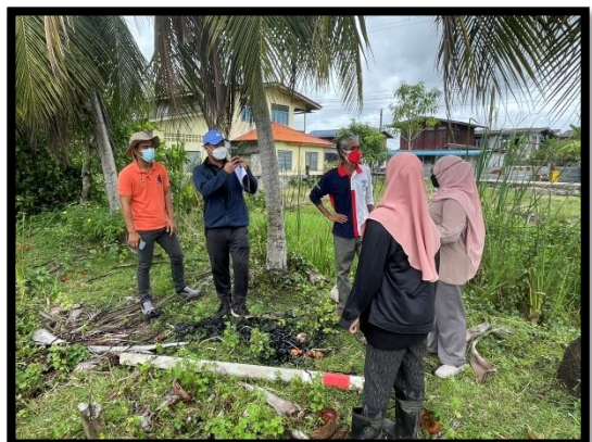
ภาพแสดงงานลงพื้นที่ตรวจสอบแนวเขตที่ดินร่วมกับกรรมการจัดซื้อที่ดิน