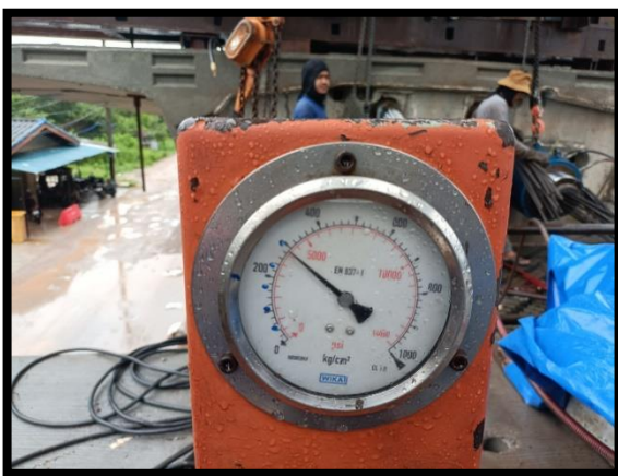
ภาพแสดงงานติดตั้งอัดแรง Segment ๑๐๐% ตามยาว ช่วง P๑ ถึง P๒