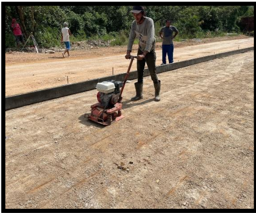
ภาพแสดงงานปรับเกลี่ยและบดอัดทรายหยาบ Sta.๐+๒๘๐ ถึง Sta.๐+๓๑๐ (RT)