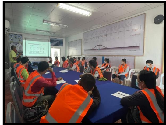
ภาพแสดงการอบรมบรรยายความปลอดภัยในการทำงาน (EIA)