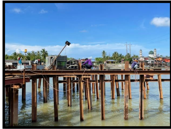
ภาพแสดงงานติดตั้ง Beam งาน Jetty ข้ามคลองท่ามะลิ่ง