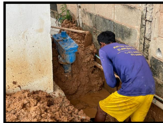
ภาพแสดงงานเชื่อมต่อท่อประปาโดยเจ้าของหน่วยงาน