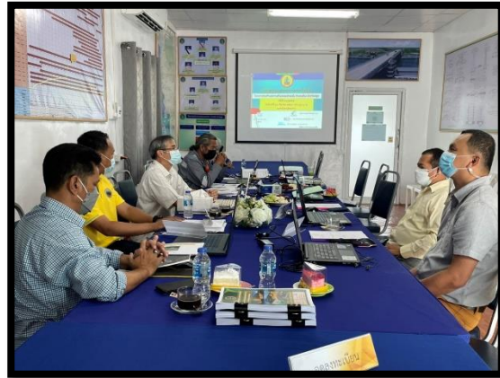
ภาพแสดงการประชุมติดตามความก้าวหน้า ผ่าน zoom conference