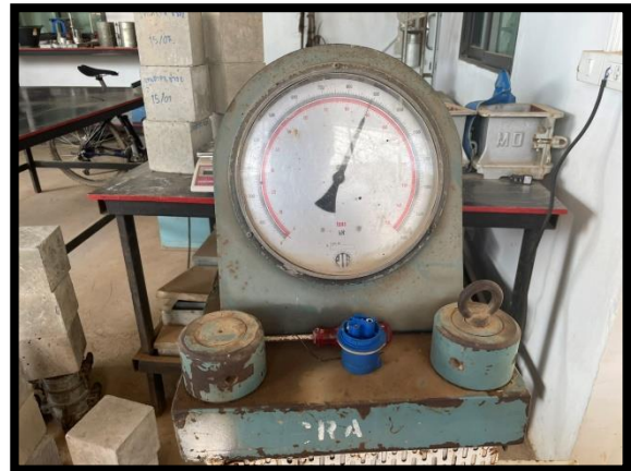
ภาพแสดงการควบคุมคุณภาพคอนกรีต