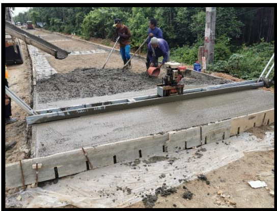
ภาพแสดงงานเทคอนกรีต Sta.๐+๐๒๐ ถึง Sta.๐+๒๗๐ (RT)