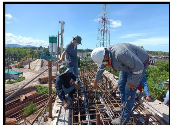
ภาพแสดงงานผูกเหล็กและตรวจสอบลวดอัดแรง Pier Head Segment (P๖)