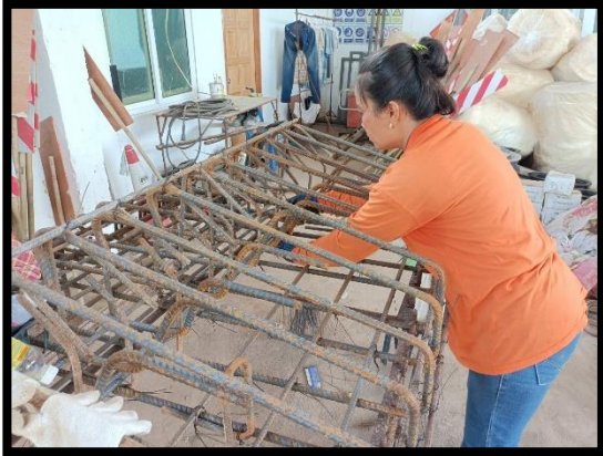
ภาพแสดงงานผูกเหล็ก Barrier