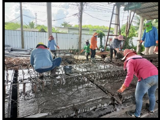
ภาพแสดงงานเทคอนกรีต Barrier