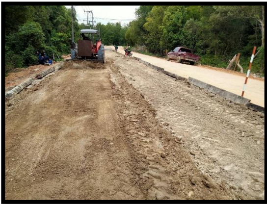
ภาพแสดงงานปรับเกลี่ยและบดอัดทรายหยาบ Sta.๐+๐๒๐ ถึง Sta.๐+๒๗๐ (RT)