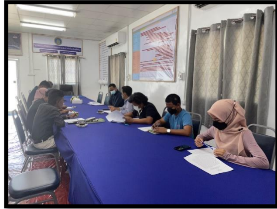
ภาพแสดงการประชุมติดตามความก้าวหน้าของโครงการ