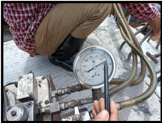
ภาพแสดงงานดึงลวดอัดแรงทางขวาง P๔