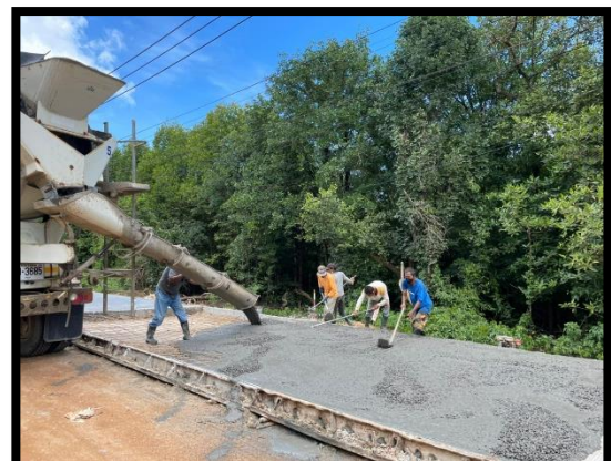
ภาพแสดงงานเทคอนกรีต Sta.๐+๐๒๐ ถึง Sta.๐+๒๗๐ (RT)