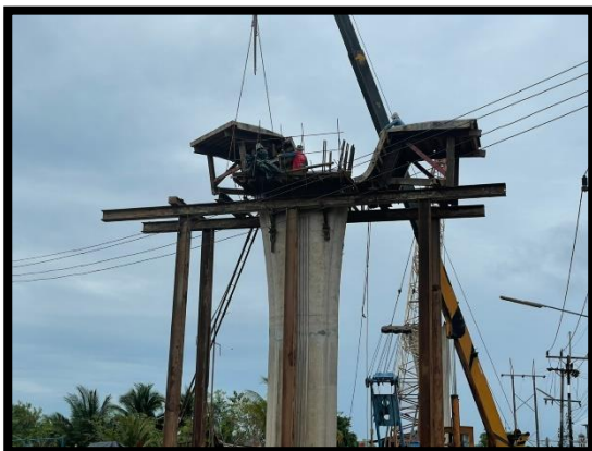
ภาพแสดงงานติดตั้งอุปกรณ์ Pier Head Segment (P๖)