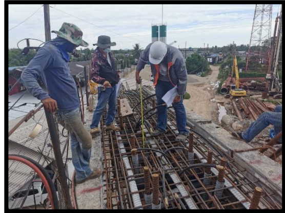
ภาพแสดงงานตรวจสอบลวดอัดแรง Pier Head Segment (P๕)