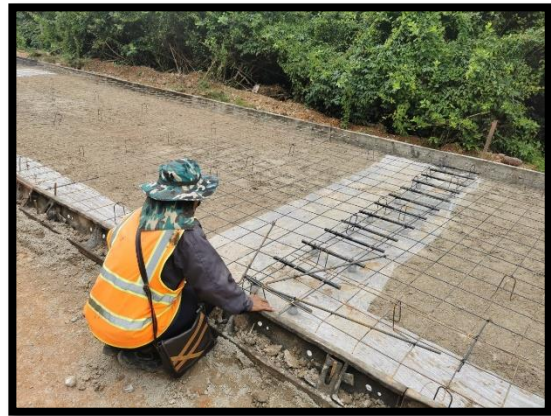
ภาพแสดงงานติดตั้งเหล็กพร้อมเข้าแบบข้าง งานถนน Sta.๐+๐๒๐ ถึง Sta.๐+๒๗๐ (RT)