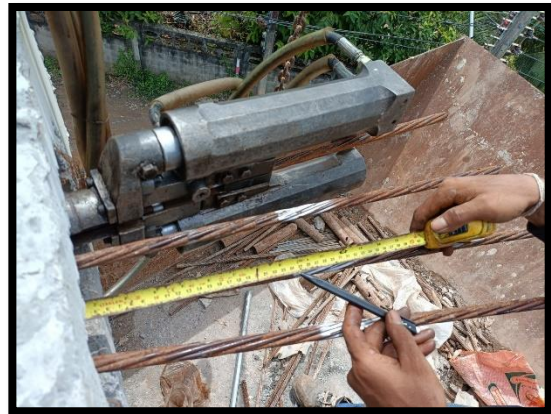
ภาพแสดงงานดึงลวดอัดแรงทางขวาง P๔