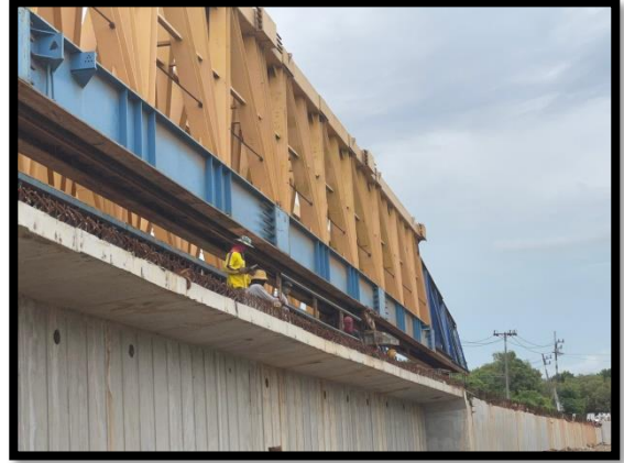
ภาพแสดงงานประกอบและติดตั้ง Launcher P๑ - P๓