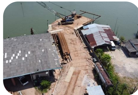
งานติดตั้งนั่งร้านสำหรับเสาเข็ม เจาะ P9 และ P10