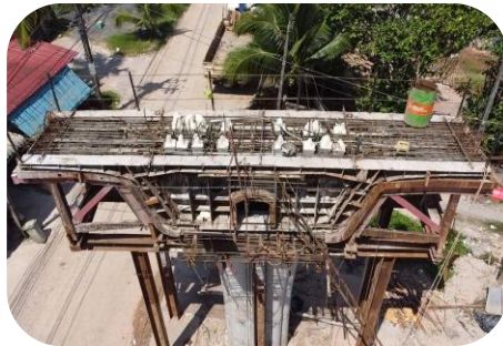
งานหล่อ Segment Type P (P4)