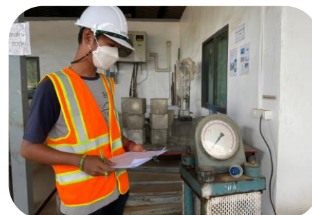
งานตรวจสอบคุณภาพคอนกรีต

“คุณภาพเป็นหนึ่ง คำนึงความปลอดภัย ใส่ใจจราจร เอื้ออาทรประชาชน”