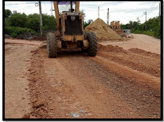
ภาพแสดงงานปรับเกลี่ยและบดอัดชั้นรองพื้นทาง Sta.๐+๑๕๐ ถึง Sta.๐+๕๐๐