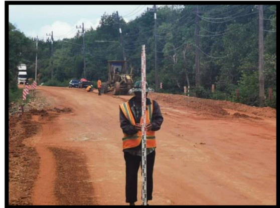
ภาพแสดงงานตรวจสอบระดับชั้นรองพื้นทาง Sta.๐+๐๒๐ ถึง Sta.๐+๑๐๐