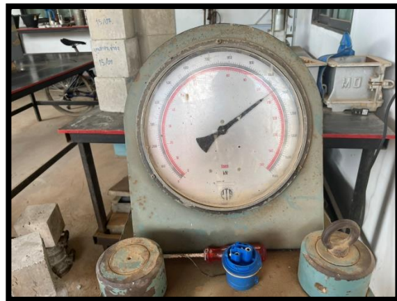
ภาพแสดงการควบคุมคุณภาพคอนกรีต