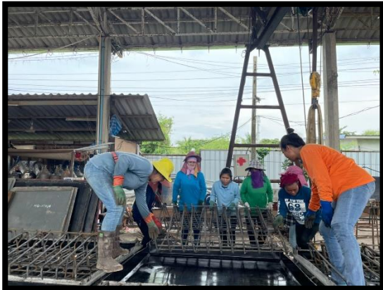
ภาพแสดงงานผูกเหล็ก Barrier