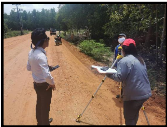
ภาพแสดงงานตรวจสอบระดับชั้นรองพื้นทาง Sta.๐+๐๒๐ ถึง Sta.๐+๑๐๐