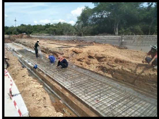
ภาพแสดงงานผูกเหล็กโครงสร้างฐานรากกำแพงกันดิน (RT)