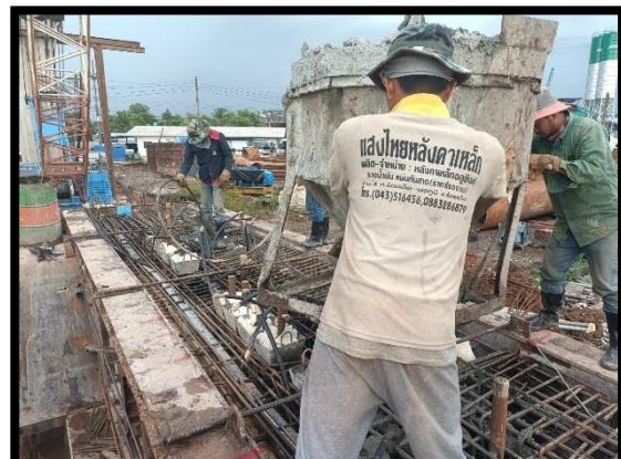
ภาพแสดงงานเทคอนกรีต Pier Segment (P๗)