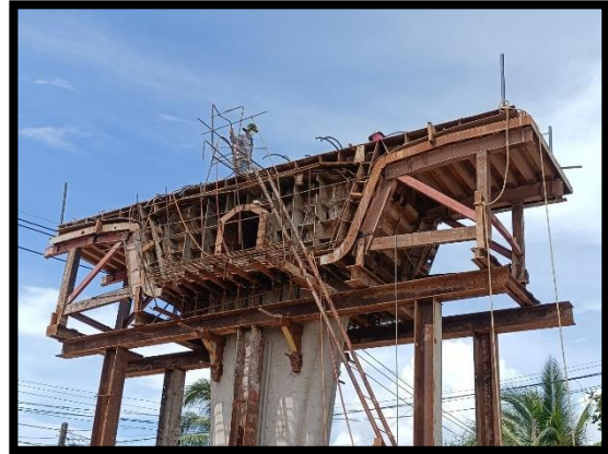
ภาพแสดงงานผูกเหล็ก Pier Segment (P๔)