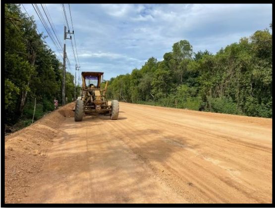
ภาพแสดงงานปรับเกลี่ยและบดอัดชั้นรองพื้นทาง Sta.๐+๐๒๐ ถึง Sta.๐+๑๕๐