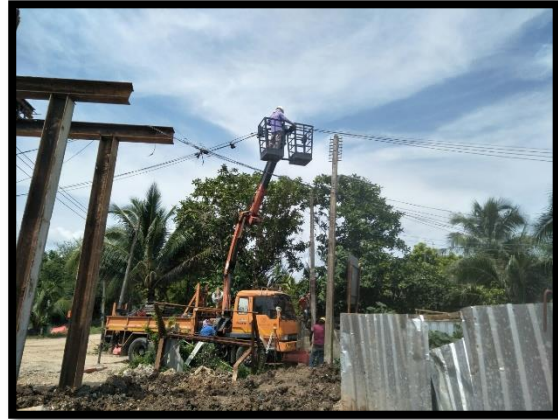
ภาพแสดงงานรื้อย้ายเสาไฟฟ้าแรงต่ำจากเจ้าของหน่วยงาน จำนวน ๕ ต้น