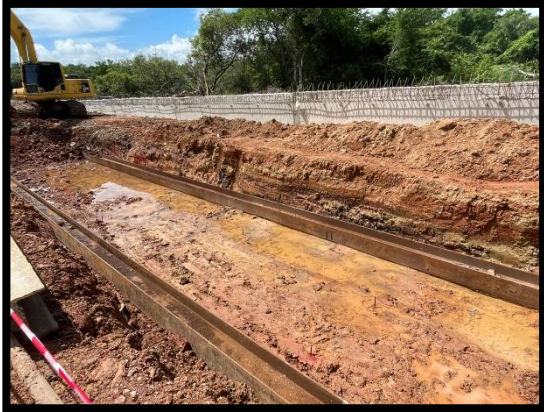
ภาพแสดงงานเปิดหน้าดินเตรียมงานกำแพงกันดิน (RT)