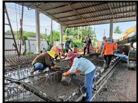
ภาพแสดงงานเทคอนกรีต Barrier