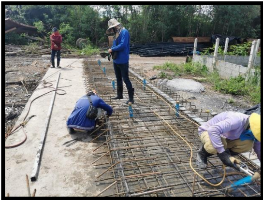
ภาพแสดงงานผูกเหล็กผนังกำแพงกันดิน (RT)