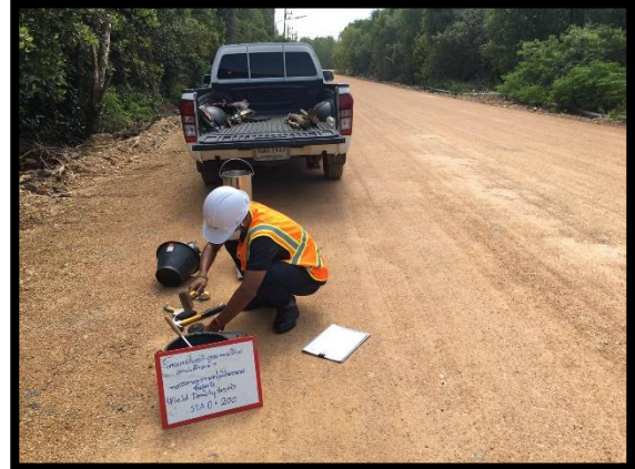
ภาพแสดงงานทดสอบความหนาแน่นของชั้นรองพื้นทาง Sta.๐+๐๒๐ ถึง Sta.๐+๓๕๐