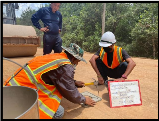
ภาพแสดงงานทดสอบความหนาแน่นของชั้นรองพื้นทาง Sta.๐+๐๒๐ ถึง Sta.๐+๓๕๐