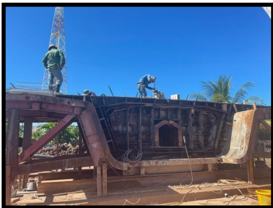
ภาพแสดงงานผูกเหล็ก Pier Segment (P๗)