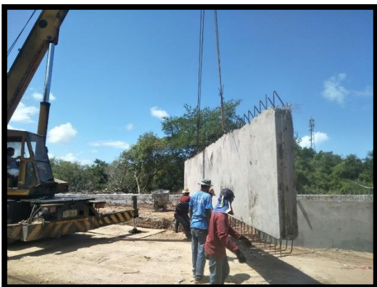
ภาพแสดงงานติดตั้งผนังกำแพงกันดิน (RT)