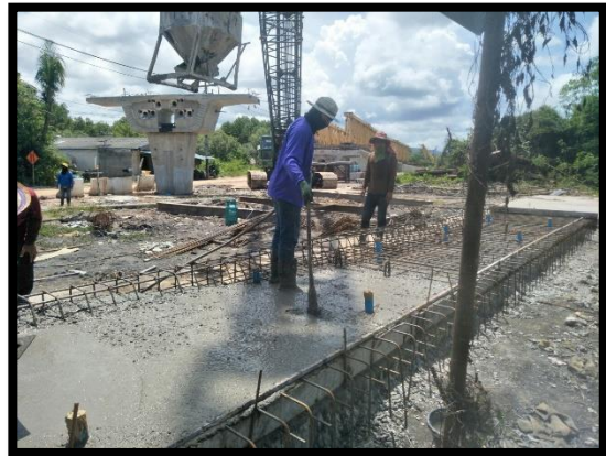
ภาพแสดงงานเทคอนกรีตผนังกำแพงกันดิน (RT)