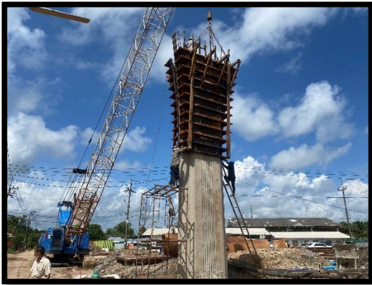
ภาพแสดงงานเข้าแบบโครงสร้างเสาตอม่อ (P๖) ช่วงที่ ๓