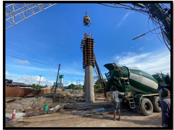
ภาพแสดงงานเทคอนกรีตเสาตอม่อ (P๖) ช่วงที่ ๓