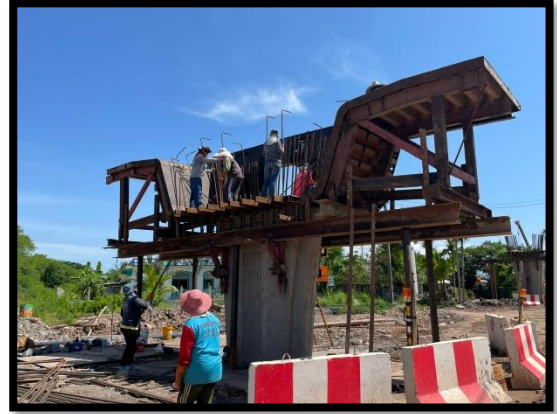
ภาพแสดงงานผูกเหล็ก Pier Segment (P๒)