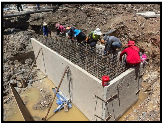
ภาพแสดงงานผูกเหล็กฐานราก (P๖)