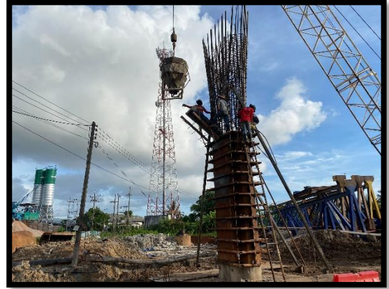
ภาพแสดงงานเทคอนกรีตเสาตอม่อ (P๖) ช่วงที่ ๒