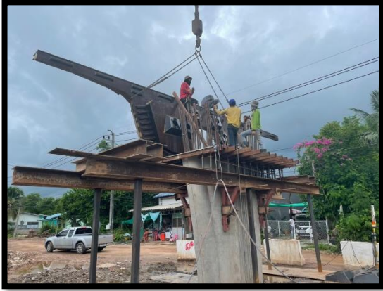
ภาพแสดงงานติดตั้ง Pier Segment (P๒)

ภาพถ่ายความก้าวหน้างาน ประจำเดือนพฤษภาคม ๒๕๖๔