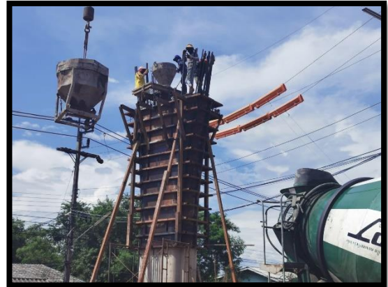
ภาพแสดงงานเทคอนกรีตเสาตอม่อ (P๕) ช่วงที่ ๒