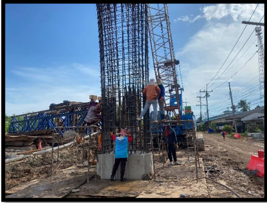
ภาพแสดงงานผูกเหล็กโครงสร้างเสาตอม่อ (P๖)

ภาพถ่ายความก้าวหน้างาน ประจำเดือนพฤษภาคม ๒๕๖๔