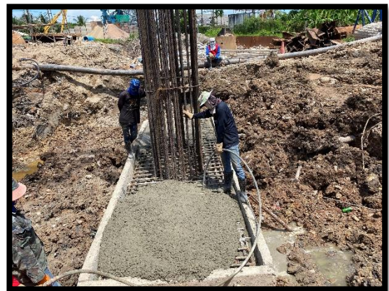
ภาพแสดงงานเทคอนกรีตฐานราก (P๖)