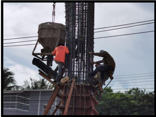
ภาพแสดงงานเทคอนกรีตเสาตอม่อ (P๕) ช่วงที่ ๑

ภาพถ่ายความก้าวหน้างาน ประจำเดือนพฤษภาคม ๒๕๖๔