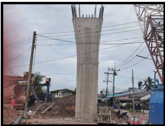
ภาพแสดงงานถอดแบบโครงสร้างเสาตอม่อ (P๖)