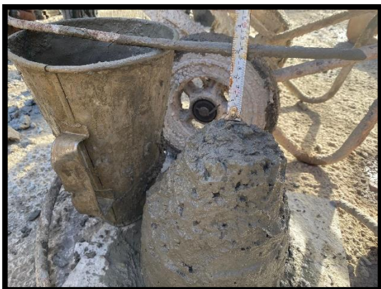
ภาพแสดงการตรวจสอบคุณสมบัติวัสดุ