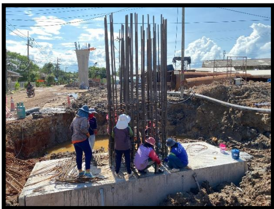
ภาพแสดงงานผูกเหล็กโครงสร้างเสาตอม่อ (P๖) ช่วงที่ ๑