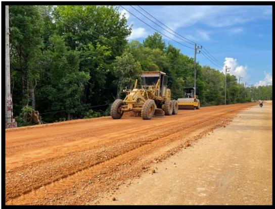
ภาพแสดงงานปรับเกลี่ยและบดอัดชั้นรองพื้นทาง Sta.๐+๐๐๐ - Sta.๐+๔๕๐