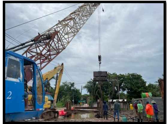
ภาพแสดงงานติดตั้งระบบป้องกันดินพังทลาย (P๔)