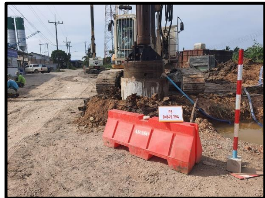
ภาพแสดงงานเสาเข็มเจาะขนาดเส้นผ่านศูนย์กลาง ๑.๕๐ ม. (P๕/๒)