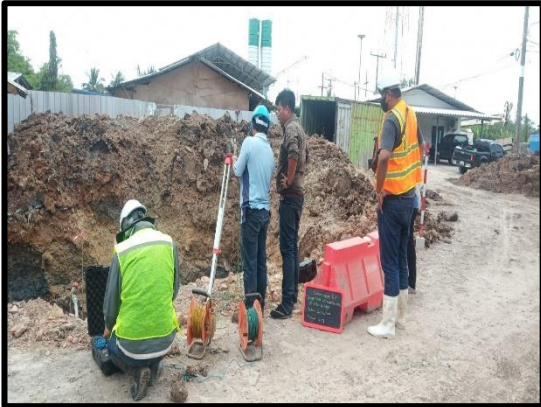
ภาพแสดงงานทดสอบความสมบูรณ์ของเสาเข็มเจาะ ด้วยวิธี Sonic logging