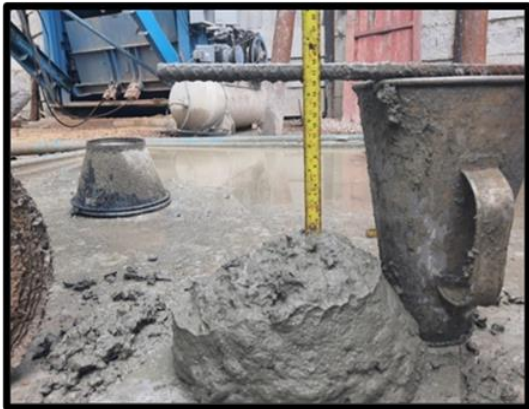
ภาพแสดงการตรวจสอบคุณสมบัติวัสดุ