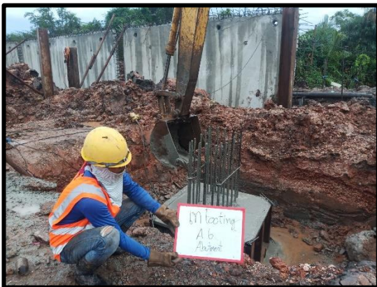
ภาพแสดงงานเท Footing Abutment