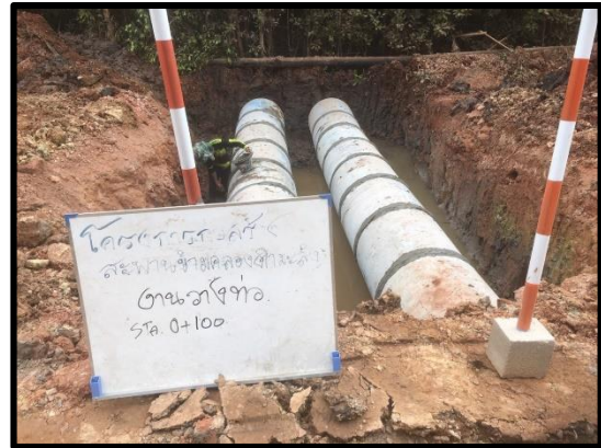
ภาพแสดงงานวางท่อ คสล. Ø ๐.๘๐ เมตร