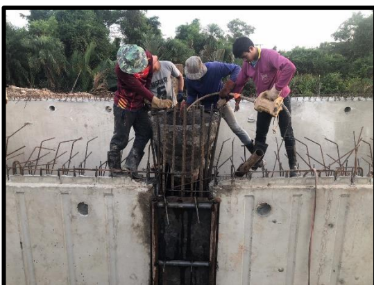
ภาพแสดงงานเทเสา ผนัง Abutment