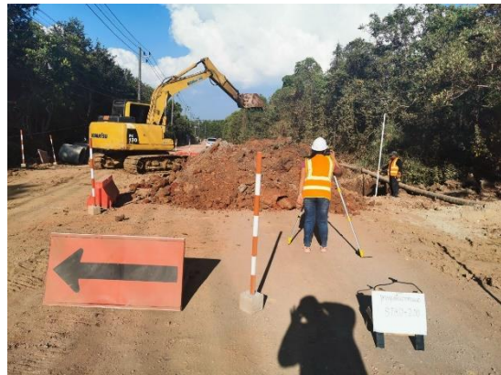
ภาพแสดงงานเก็บค่าระดับดิน