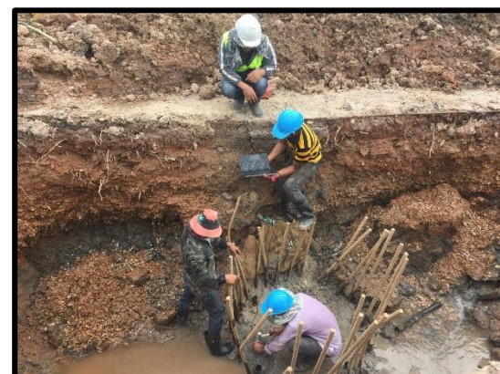
ภาพแสดงงานทดสอบความสมบูรณ์ของเสาเข็มเจาะ ด้วยวิธี Seismic