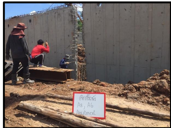
ภาพแสดงงานติดตั้งผนัง (Abutment)