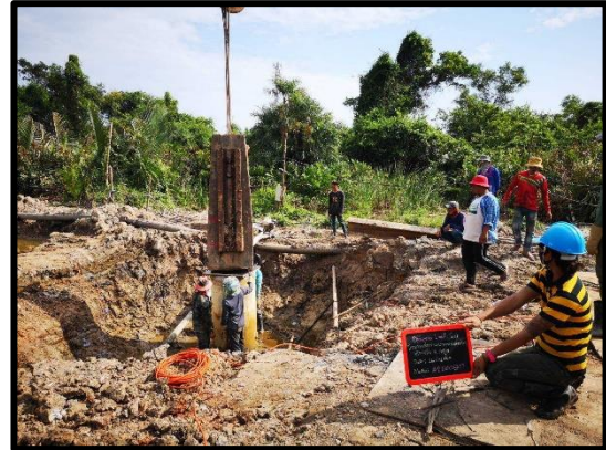
ภาพแสดงงานทดสอบความสมบูรณ์ของเสาเข็มเจาะ ด้วยวิธี Dynamic